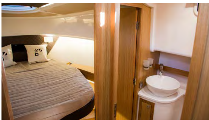
Romslig bofølelse: Lugaren forut har tilknyttet bad og eget dusjrom.