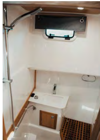
Eget dusjrom: På babord side forut er et eget dusjrom.