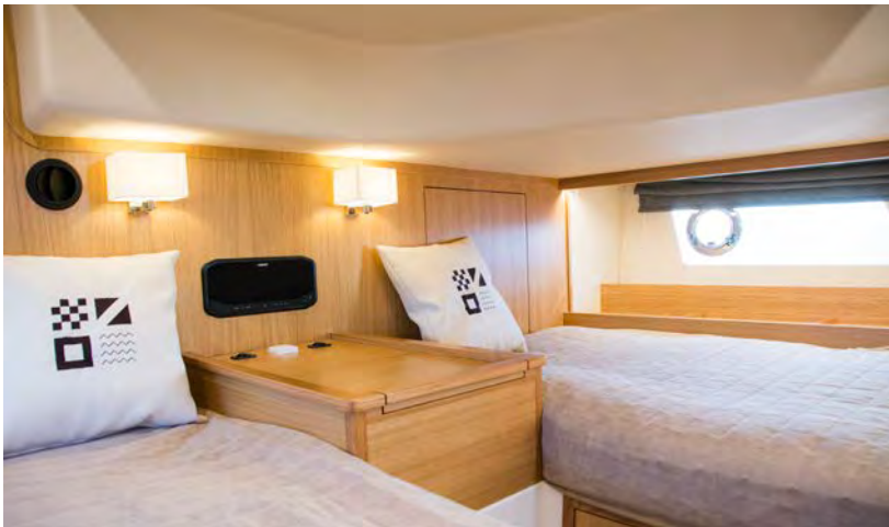
Lyst med skrogvinduer: Midtkabinen har to separate senger og skrogvinduer som gir lys og utsikt.