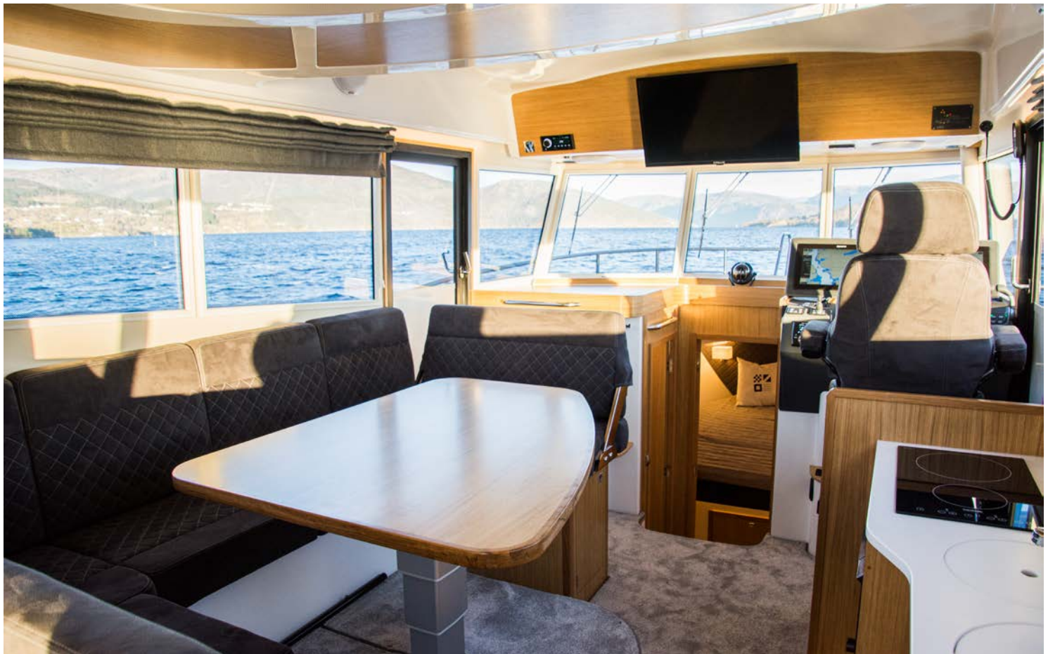
U-sofa med to vinkler: Salongen har god høyde, og du kan vippe den ene ryggen bakover for å få to sitteplasser i fartsretning.

Nord Star 42+ er et velkjent og ikke minst velprøvd styrhusbåtkonsept. Det betyr at den er bygget for bruk hele året og i tøffere omstendigheter. Den har en dyp v-bunn med 18,5 grader i hekken, legger seg godt over i svingene og byr på forutsigbare kjøreegenskaper. Vår testbåt har interceptorer fra Zipwake som under vår testtur bidro til god stabilitet. 44-foteren utrustes med to Volvo Penta D6 fra 340 hk. opp til 440 hk., eller med IPS600 eller IPS650. Med største