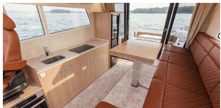
Også i Cruiser-utgave: Nord Star 42+ kommer også i "Cruiser-utgave" blant annet med utvidet bysseløsning.